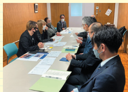
※詳細は2ページ 校長挨拶文に記載