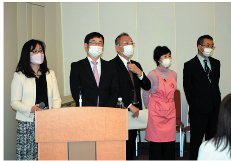
スタッフの皆様と

今だ続くコロナ禍の為、令和 2 年度の総会は中止、昨年度も慌ただしく議事のみ採択の淋しい総会で、特別講演や交流パーティは中止となりましたが、今年も幹事学年の高 44 回生の皆様の準備していた特別講演や卒後 30 年後の楽しい筈の同期会も見送